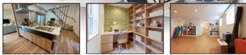
栓家オリジナルキッチン 完全個室の書斎 大容量な小屋裏収納