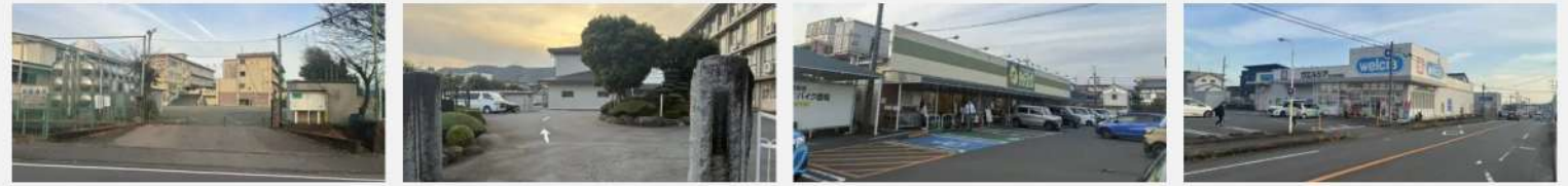
富丘小学校 約950m(徒歩12分) 富士宮第四中学校 約900m(徒歩12分) ポテト淀川店 約700m(徒歩9分) ウエルシア富士宮淀師店 約600m(徒歩8分)

JR身延線 「西富士宮」駅 徒歩 19 分 富士宮コミュニティバス 「淀師区民館前」徒歩 2 分