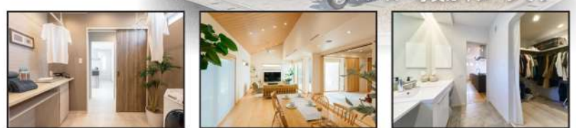
家事楽!ランドリールーム ダイナミックな勾配天井 1階に家族のWIC